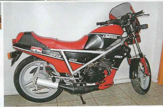
Hochwertige Komponenten von Marzocchi adeln die 125er. Die VDO-Instrumente haben die Zündapp 125 und die frühen Laverdas gemein. Sammler Struve verfügt über ein beachtliches Teilelager. Mit der grünen LZ 125 begann alles, die Uno gab's auch in dieser Lackvariante

125ern durchaus im Drehzahlkeller bummeln kann, muss man diese Maschine bis 11 000 Umdrehungen fahren, damit man überhaupt vorankommt. Oben herum ist sie aber deutlich giftiger als die früheren Laverdas“, berichtet der Zweitakt-Fan. Weil mehr Schaltarbeit angesagt war, spendierte man der Lesmo ein Sechsganggetriebe. Damit erreicht sie laut Tacho beachtliche 135 Stundenkilometer, die älteren Modelle streichen bereits etwa bei 120 km/h die Segel. Der Nachfolger der Lesmo stand Ende der achtziger Jahre mit der Laverda 125 Navarro bereits in den Startlöchern, vermutlich sind aber keine Serienexemplare mehr gebaut